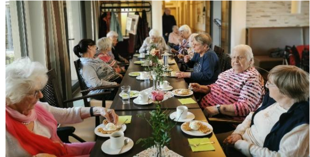
Gemeinsames Kaffeetrinken mit unserem Besuch aus Ahnatal