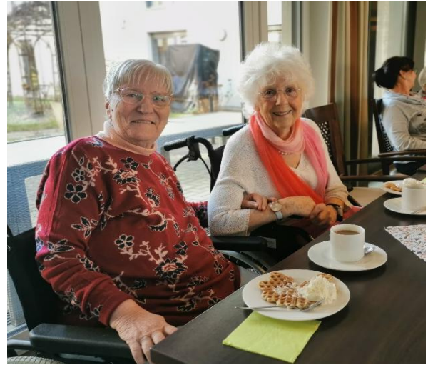
Wiedersehen macht Freu(n)de