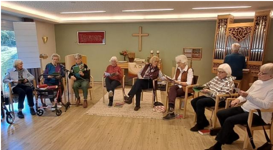
Vorbereitung für den Weltgebetstag