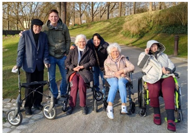
Ausflug in den Ahnepark

Die nächste Ausgabe von STIFTSHEIM AKTUELL erscheint am 01. Juni 2026