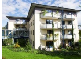
Haus am Stiftsheim